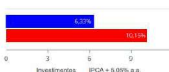
Investimentos x Meta de Rentabilidade